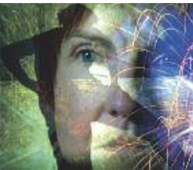
▲ Les mémoires vives, la métallière

La Cinémathèque de Bretagne et l'INA Atlantique vous proposent des balades chantées au cœur de la Bretagne des années 60 et 70, en compagnie de grands artistes... Bonne humeur garantie !