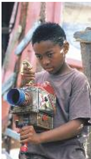
▲ la caméra de bois

(*) La force, le pouvoir ! (cri de ralliement zoulou).